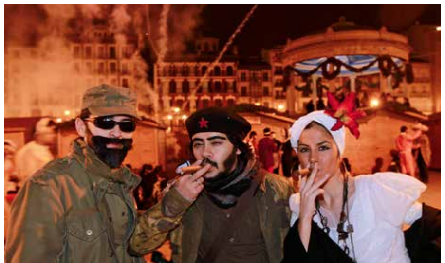
Nochevieja Plaza del Castillo, Pamplona.

También el 13 de febrero, en el norte de la comunidad se verá a Miel Otxin y Ziripot, y a los Momotxorros, el Hartza y los zaku zaharrak; en la Ribera destacan los zarrapotos de Cascante y los zarramusqueros en Cintruénigo , así como el popular desfile del carnaval de Villafranca.