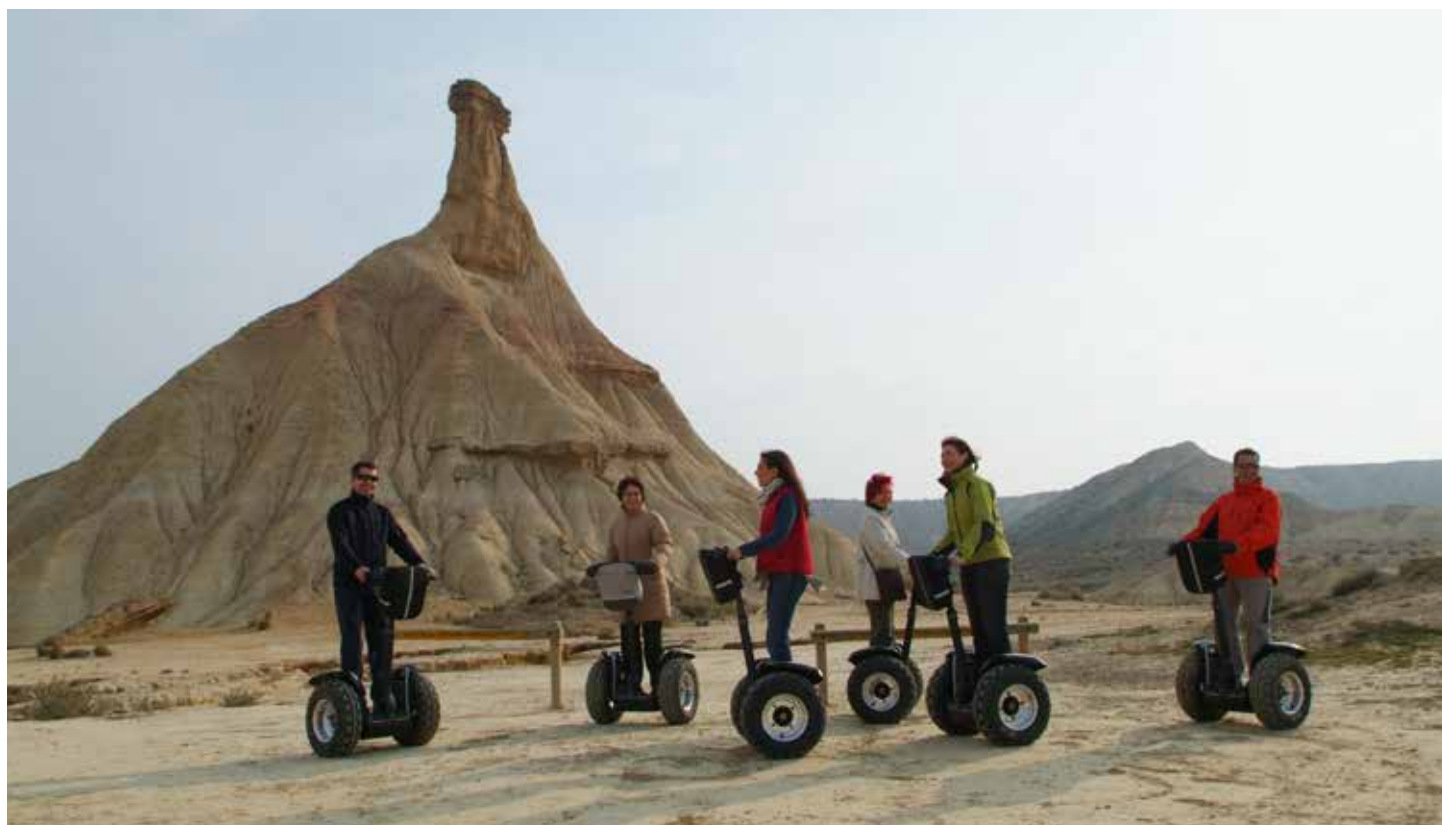
Excursión en Segway. Bardenas Reales.

Escalada, parque de aventura aéreo. Berrioplano. T. 948 302 437 info@rocopolis.com · www.rocopolis.com