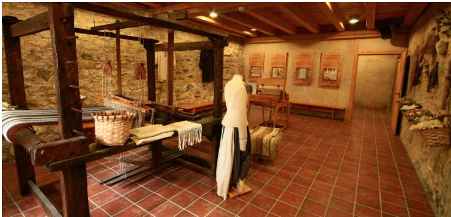
Batán de Villava.