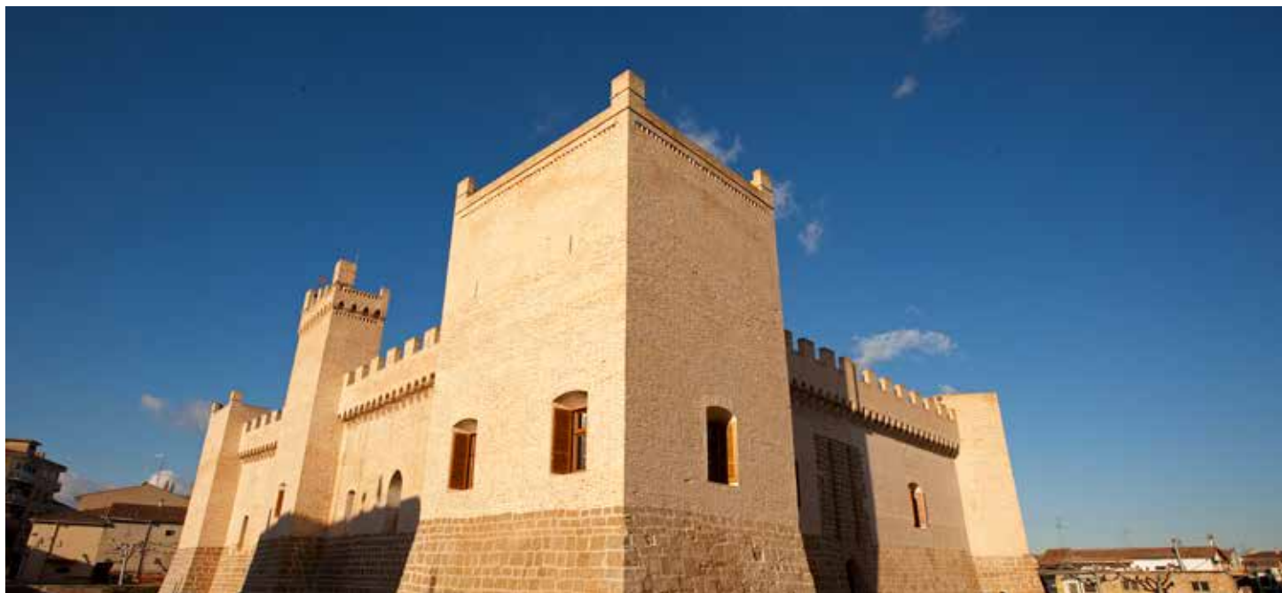
Castillo de Marcilla.