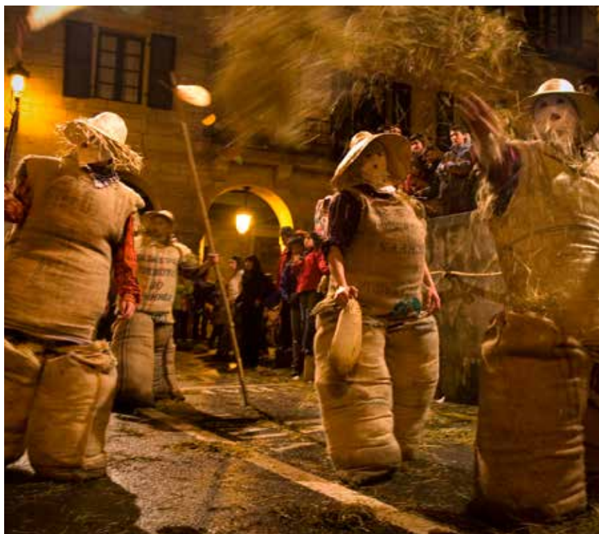
Zakuzarrak del carnaval del Lesaka.

Durante los meses más fríos del año las cumbres navarras se cubren de un gran manto blanco de nieve. Olentzero, un carbonero que baja de las montañas la víspera de Navidad, llega cargado de regalos para los niños, al igual que harán los Reyes Mayos en la tarde del 5 de enero. A finales de ese mismo mes, llega el turno de la fiesta más pagana. El color del carnaval invade los municipios de la Navarra más rural con sus rituales mágicos y personajes típicos.