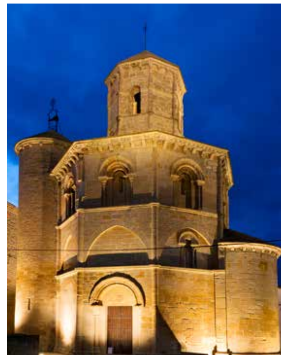
Iglesia del Santo Sepulcro de Torres del Río.