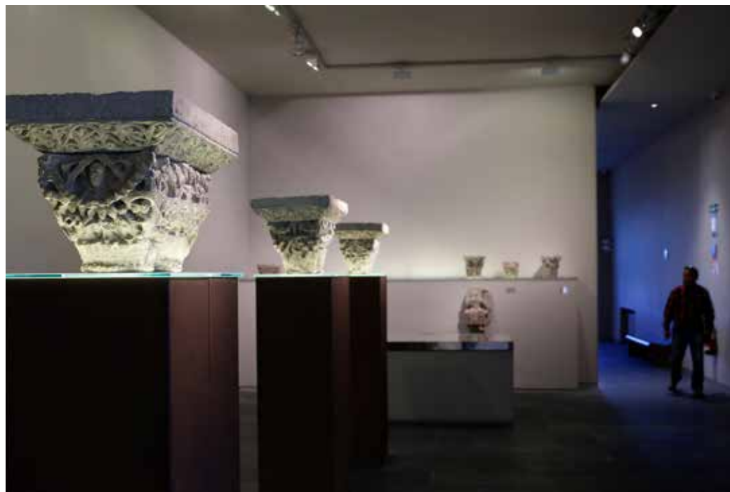
Museo de Navarra. Pamplona.

• MUSEO DE EDUCACIÓN MEDIOAMBIENTAL. (Antiguo monasterio de San Pedro). C/ Errotazar s/n. M-J 10:00-13:00h y 18:00-20:00h. V 10:00-13:00h. T. 948 149 804 / 948 123 721 www.museoambientalpamplona.com