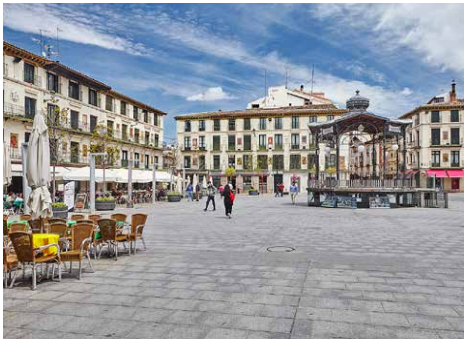
Plaza de los Fueros de Tudela.

• ERMITA DEL YUGO. A 6km de Arguedas. Bar y asadores del albergue funcionan los S y F.